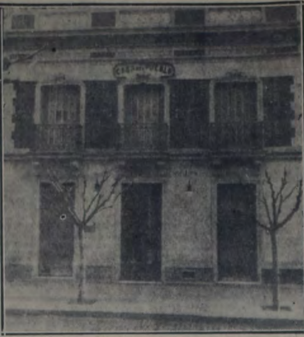
FRENTE DE LA CASA DEL PUEBLO DE JUNIN, LA PRIMERA CON QUE CONTÓ EL PARTIDO EN EL PAIS.

Desde el punto de vista de la organización gremial, cooperativa y cultural, la acción desarrollada y la influencia ejercida por el Centro Social