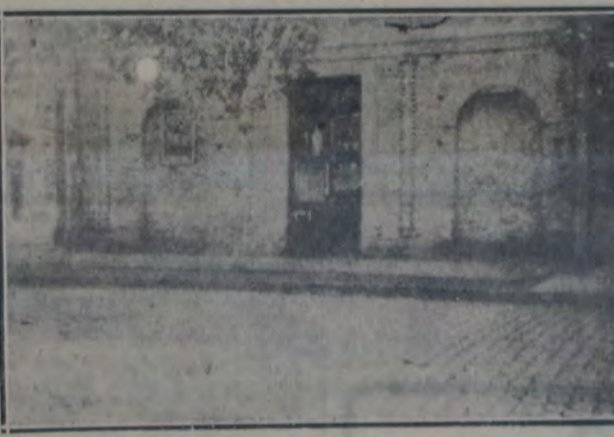
PRIMERA CASA OCUPADA POR EL CENTRO SOCIAL DEMOCRATICO EN JUNIN CON SU BIBLIOTECA, EN LA ESQUINA DE BELGRANO Y FRANCIA.